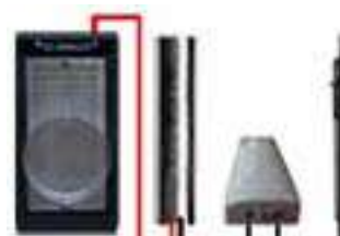
к Биотестеру МИНИ