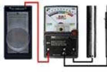
к Биотестеру БАЗ и ПРО