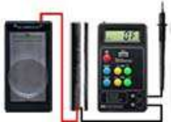
к Биотестеру БРТ